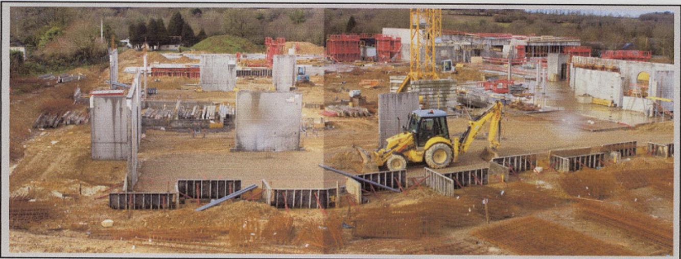
Vue de la rue de brest 21.02.2010

Le chantier de la nouvelle résidence prend de l'essor. On aperçoit au premier plan la plate-forme et le démarrage du bâtiment A, dans le fond à droite de la photo, le bâtiment F qui accueillera l'unité « Alzheimer ». La société COLESCO prévoit de couler prochainement les plates-formes des bâtiments C et D, puis début mars la plate-forme du bâtiment B.